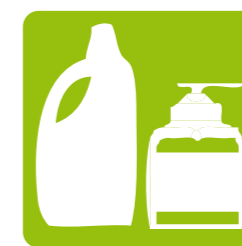
Kosmetika/ Garbitasuna Cosmétique Hygiène