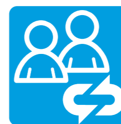
Bigarren eskukoa/ Trukea Occasion/Troc