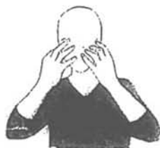
Ez dut ulertzen