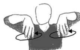
Ez naiz ados